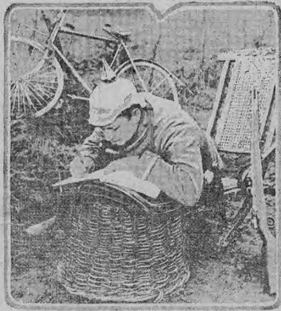
GERMAN SOLDIER KEEPING HIS DIARY

Este documento es propiedad de la Biblioteca Nacional "Miguel Obregón Lizano" del Sistema Nacional de Bibliotecas del Ministerio de Cultura y Juventud, Costa Rica.